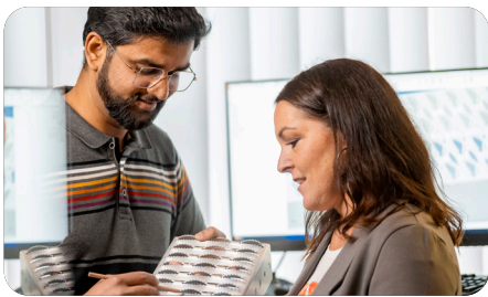
Gemeinsame Bauteilentwicklung, Design und Prototypenbau

Die Produkte sind gefragte Komponenten für mehr Sicherheit an Fahrzeugen aller Art, im Anlagenbau und als Fassadenelement in der Architektur. Seit 1889 stellt Graepel täglich seine Kompetenz in Sachen gelochtes und verformtes Blech unter Beweis.