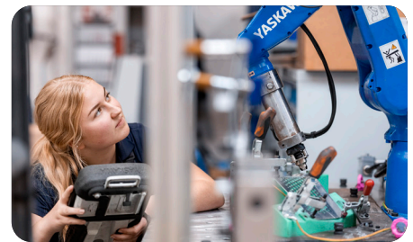
Produktion von Klein- und Großserien